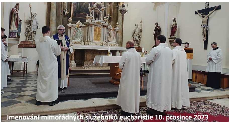
Jmenování mimořádných služebníků eucharistie 10. prosince 2023

- mezi služby akolyty patří: přinášet přijímání nemocným, konat službu u oltáře, pomáhat knězi při liturgických úkonech, vystavovat Nejsvětější svátost a v mimořádných případech, např. když kněz nemůže slavit nedělní mši svatou, může akolyta vést Bohoslužbu slova s udílením svatého přijímání